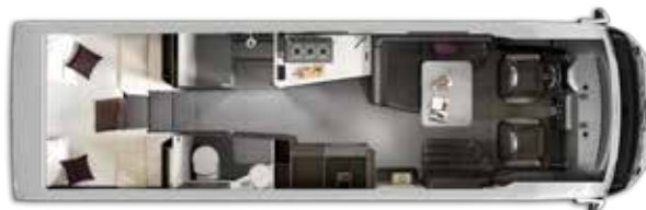
Nº plazas Homologadas: 4