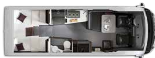
Nº plazas Homologadas: 4