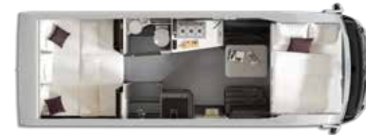
Nº plazas Dormir: 4+1