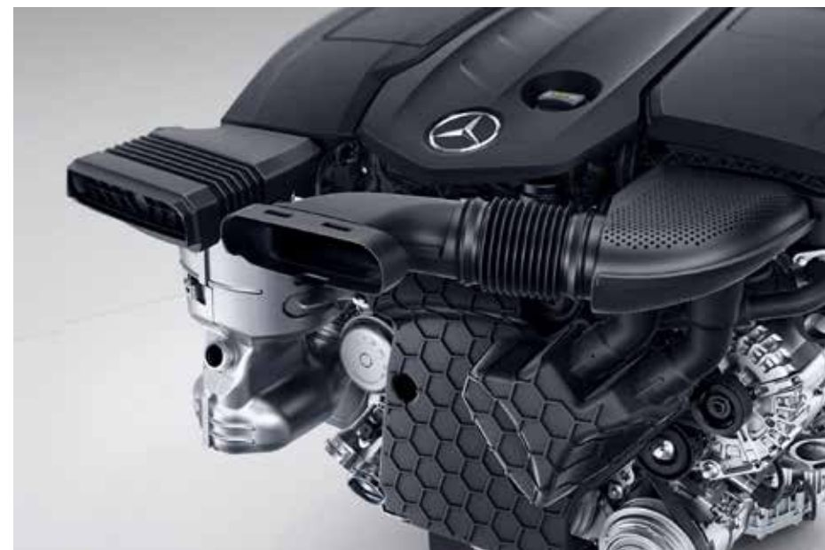
Motores diésel Euro 6 2.0 l de 150 CV y 170 CV, con máxima potencia y par.

Modernos sistemas de transmisión y asistencia al conductor 9G-Tronic (automático) para desempeño, seguridad, manejo y comodidad o transmisión manual 6G. Ver motor y caja de cambios en la siguiente tabla.