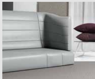
VEGAN LEATHER SVERRE