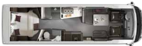
Nº plazas Homologadas: 4