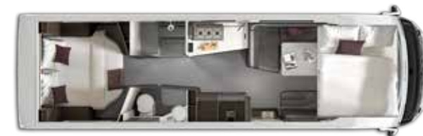
Nº plazas Dormir: 4