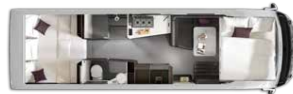
Nº plazas Dormir: 4+1