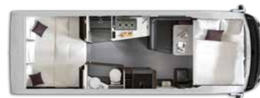
Nº plazas Dormir: 4+1